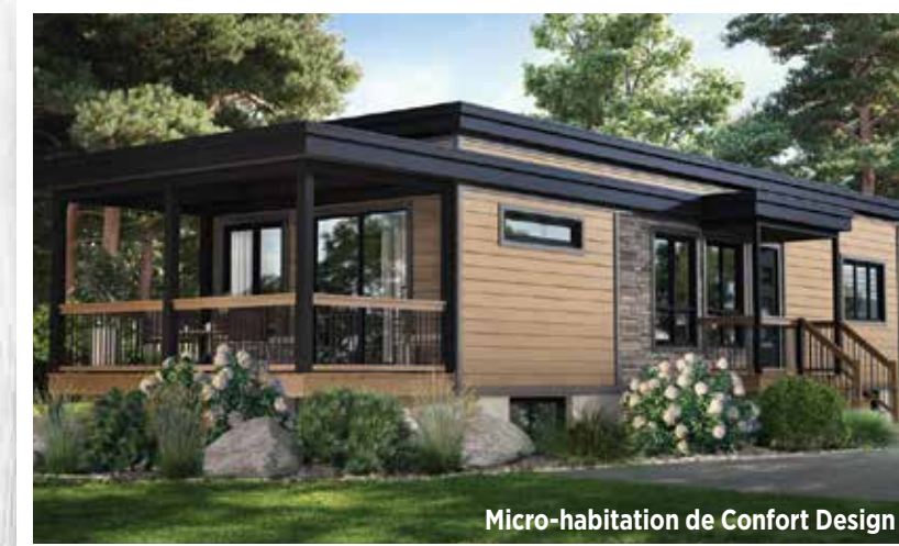
Micro-habitation de Confort Design